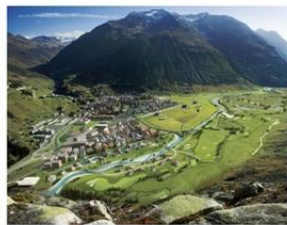
富甲天下 • Apex Manual 154